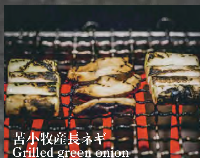
苫小牧産長ネギ Grilled green onion