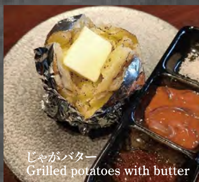
じゃがバター Grilled potatoes with butter