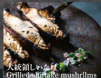
大統領しいたけ Grilled shiitake mushrooms