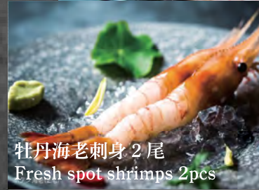
牡丹海老刺身 2尾 Fresh spot shrimps 2pcs