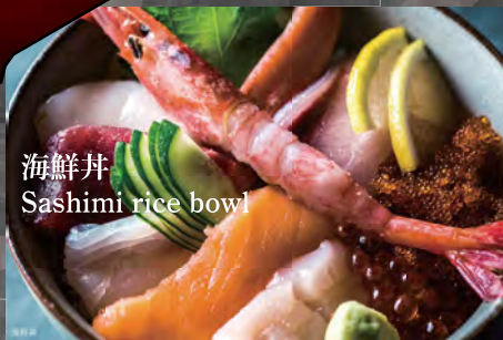
海鮮丼 Sashimi rice bowl