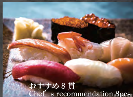
おすすめ 8 貫 Chef's recommendation 8pcs