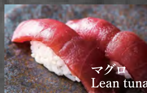
マグロ Lean tuna