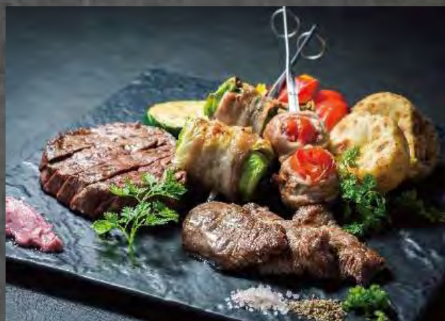
・北海道産肉炙りセット (牛ヒレ/ラム/麦豚ロール2種)

Grilled assorted meats (beef/lamb/pork) ¥4,000