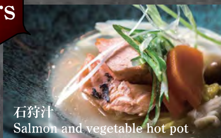
石狩汁 Salmon and vegetable hot pot