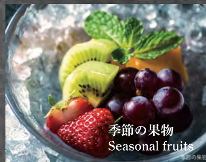
季節の果物 Seasonal fruits