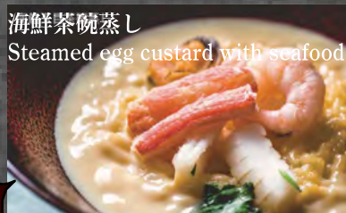
海鮮茶碗蒸し Steamed egg custard with seafood