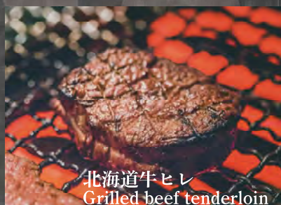
北海道牛ヒレ Grilled beef tenderloin