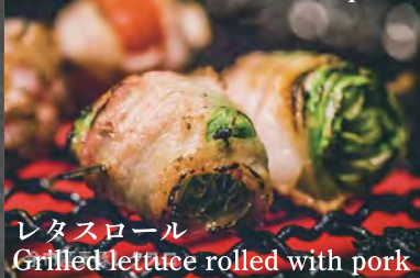
レタスロール Grilled lettuce rolled with pork