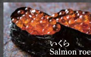
いくら Salmon roe